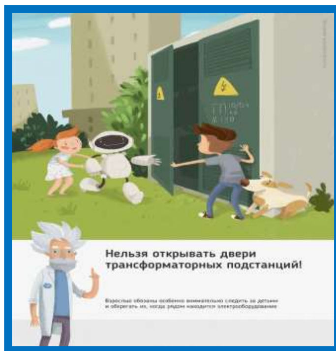
Рис.1 Нельзя открывать двери трансформаторных подстанций

Ежегодно энергетики проводят для школьников познавательные уроки, конкурсы рисунков и историй на тему электричества и правильного с ним обращения. Но работы одних энергетиков в данном направлении недостаточно, для полного понимания проблем электробезопасности нужен пример общества, в котором растет ребенок, и, конечно же, главным образом родителей. Эта работа приносит свои результаты: электротравмы на энергетических объектах единичные, и каждый случай становится поводом для служебной проверки. Но только технических мер мало для того, чтобы полностью обезопасить детей. Им нужен пример родителей.