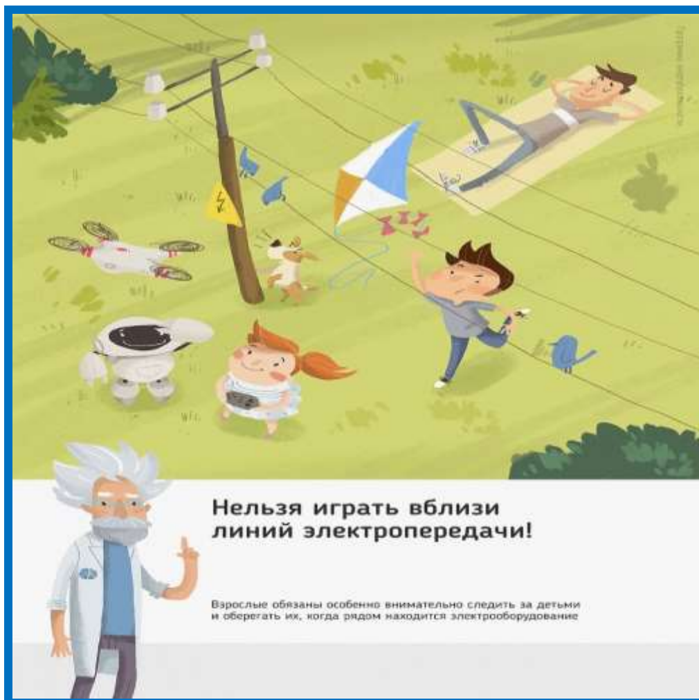
Рис.3 Нельзя играть вблизи линий электропередачи

- смертельно опасно забираться на столбы высоковольтных линий электропередачи, чтобы сделать красивую фотографию.