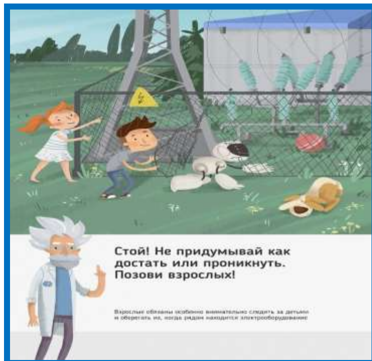
Рис. 5 Стой! Не придумывай, как достать или проникнуть. Позови взрослых!