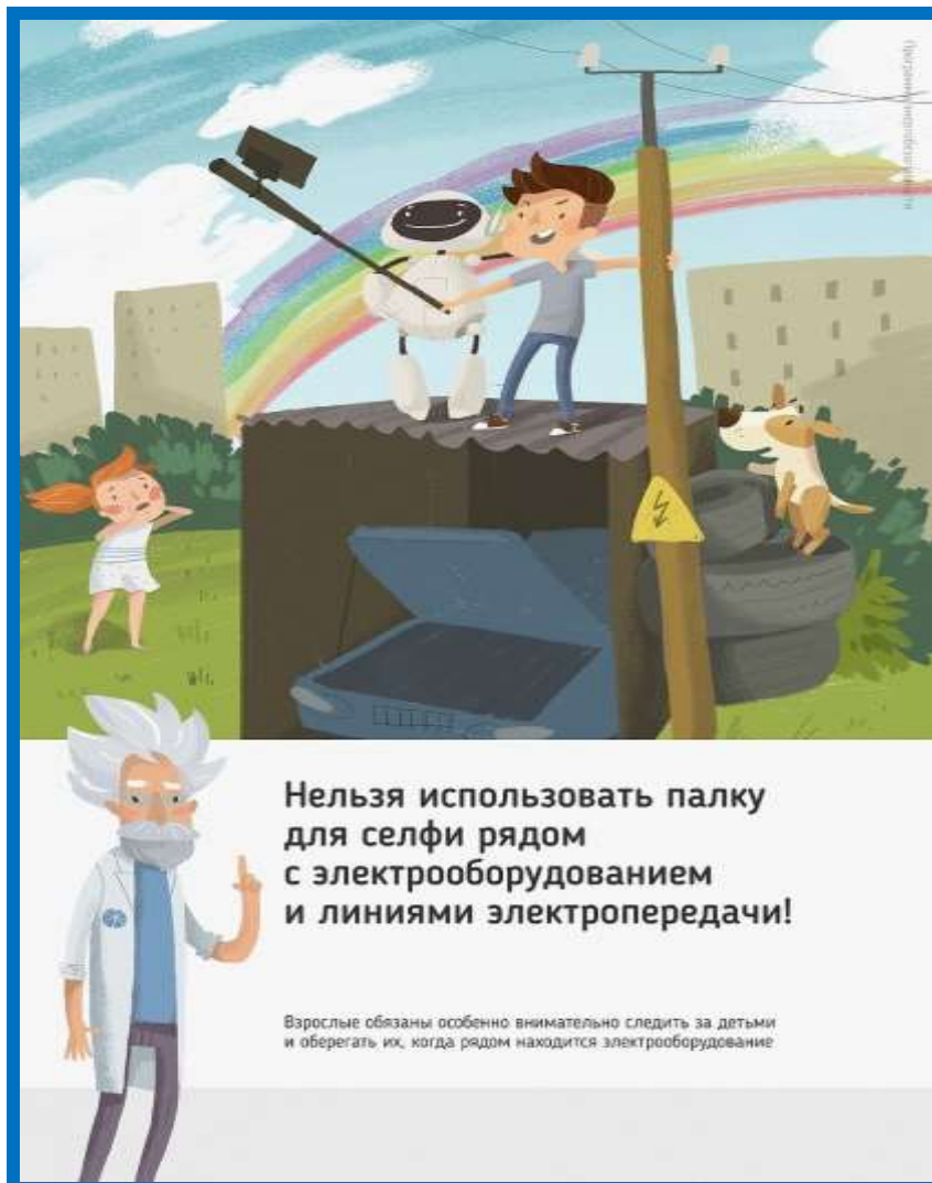
Рис 2. Нельзя использовать палку для селфи рядом с электрооборудованием

Ну и, наконец, нужно повторить с ребенком алгоритм действий в экстремальной ситуации. Проверьте, умеет ли он набирать на сотовом телефоне телефон экстренных служб. Изучите с ним вещества и предметы, которые хорошо проводят электрический ток и потому особенно опасны, и, наоборот, вещества и предметы, плохо проводящие электрический ток и полезные в экстремальной ситуации.